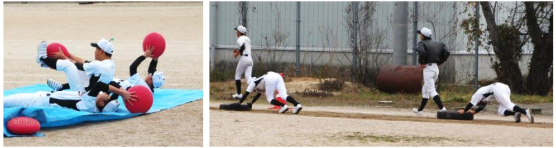
冬季トレーニングに励む部員たち（腹筋運動・タイヤ押し）

冬になると、樹木は葉を落とし、寒さの中にたたずんでいます。実は、この樹木、目にははつきりとは分かりにくいのですが、冬の間には確実に少しずつ成長しています。年輪を一つずつ増やしながら、春に芽を出すために、寒さにじっと耐えて、地中からは栄養分を蓄え、成長しているのです。