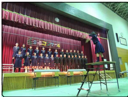
3年金賞：A組の合唱風景