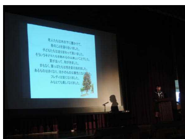
英語の童話暗唱発表