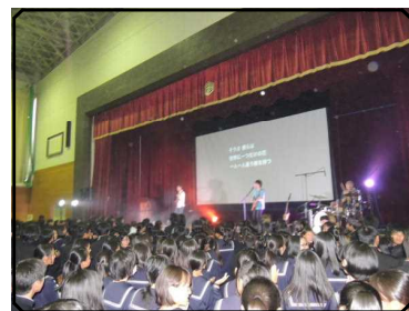
ジェリ・ビーンズ講演ライブ